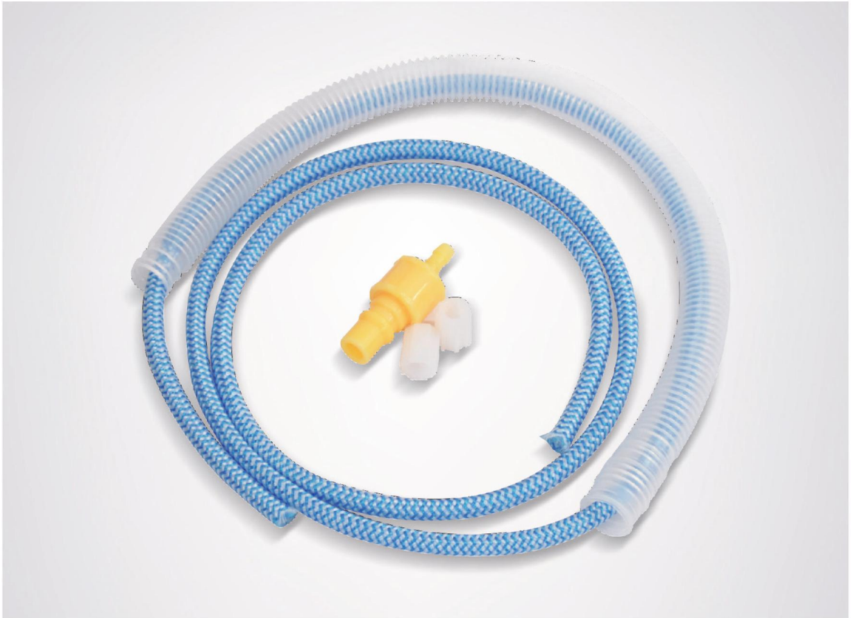
에어 그라인더 전용 호스 SG-370HS Hose for Air Grinder SG-370HS