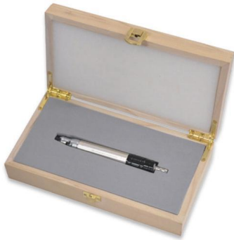
에어 그라인더 SG-370A Air Grinder SG-370A